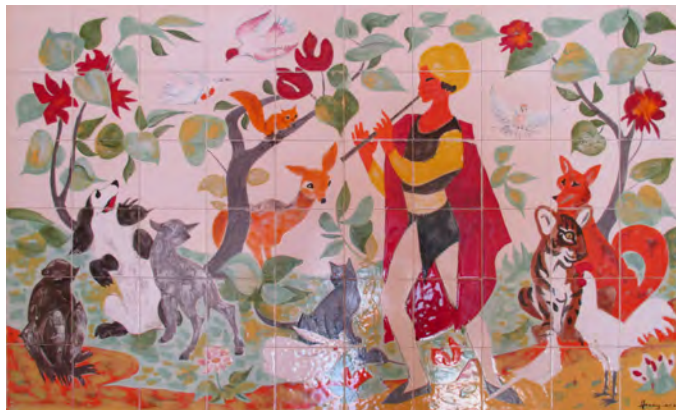
DEC_220 - Die Zauberflöte - Keramik - 1978 - 90x150

Schenkung der Stadt Rezé an die Stadt St Hilaire de Riez gerettetes Werk dank des Vereins „Les Amis d'Henry Simon“